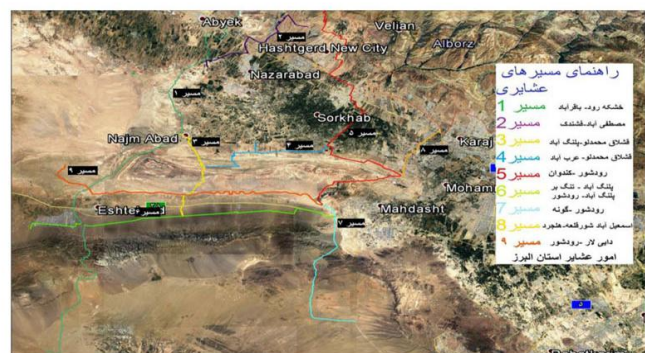
نقشه ۱ - مسیرهای عشایری استان البرز